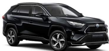
218 Fekete gyöngyház* 280000 Ft