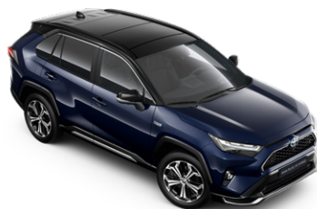
2RA Éjkék fekete tetővel* Selection Sapphire felár nélkül