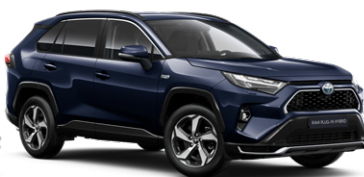
8X8 Éjkék* 280000 Ft