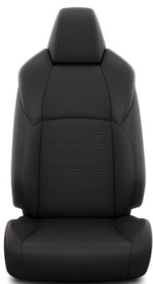
Fekete szövet Alapfelszereltség a Dynamic modellváltozaton