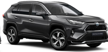
1G3 Hamuszürke* 280000 Ft