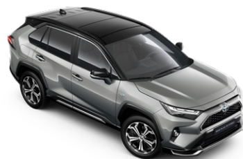
2QY Ezüstmetál fekete tetővel* Selection Platinum felár nélkül