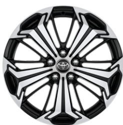
19" fekete, csiszolt felületű könnyűfém keréktárcsa (5 küllős) Alapfelszereltség a Selection és Executive modellváltozaton