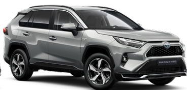
1D6 Ezüstmetál* 280000 Ft