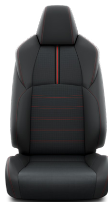
Fekete bőr Alapfelszereltség az Executive modellváltozaton