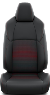
Fekete bőrhatású Alapfelszereltség a Selection modellváltozaton