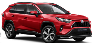
3U5 Érzéki vörös* 390000 Ft