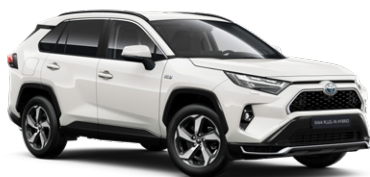
040 Hófehér felár nélkül