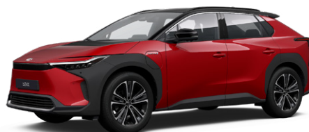
2TB Érzéki vörös, fekete tetővel SS P 120 000 Ft Executive felszereltséghez rendelhető