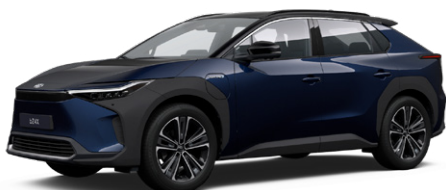
2MT Mélytenger-kék, fekete tetővel S felár nélkül Executive felszereltséghez rendelhető