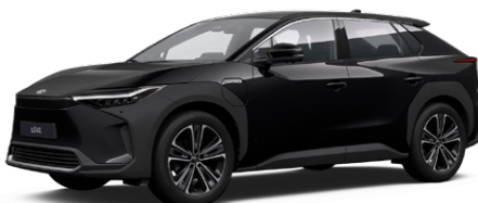
202 Asztrálfekete S felár nélkül