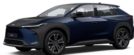
8S6 Mélytenger-kék S felár nélkül