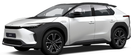
2VP Platina gyöngyfehér, fekete tetővel SS P 120 000 Ft Executive felszereltséghez rendelhető