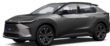
2WC Nikkelezüst, fekete tetővel SS P 120 000 Ft Executive felszereltséghez rendelhető