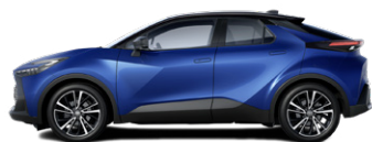
M78 Mélykék/fekete tetővel metálfényezés elérhető a Style, Style bi-tone, Executive es GR SPORT felszereltségeken