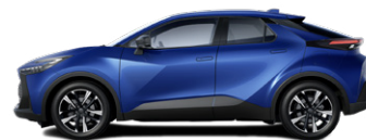
8N8 Mélykék metálfényezés 270000 Ft elérhető a Comfort, Comfort Plus, Style és Style bi-tone felszereltségeknél