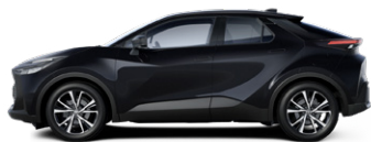
209 Éjfékete metálfényezés 270000 Ft elérhető a Comfort, Comfort Plus, Style és Style bi-tone felszereltségeknél