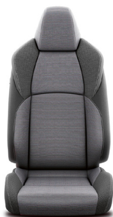
Fekete szövet ülésborítás Alapfelszereltség: Comfort Plus és Style