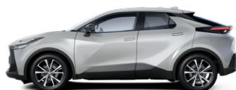
1L0 Prémium ezüst metálfényezés 270000 Ft elérhető a Comfort, Comfort Plus, Style és Style bi-tone felszereltségeknél