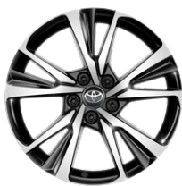
18" könnyűfém keréktárcsák, 225/55 R18 gumiabroncsok Széria a Style modellváltozaton