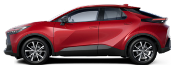
3U5 Érzéki vörös különleges fényezés 350000 Ft elérhető a Comfort, Comfort Plus, Style és Style bi-tone felszereltségeknél