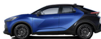
M78 Mélykék/fekete tetővel, hátsó lökhárítóval metálfényezés elérhető a GR SPORT (Dynamic csomag) felszereltségeken