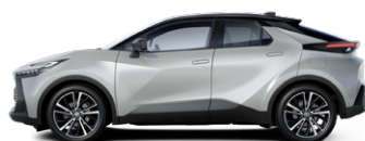
2VU Prémium ezüst/fekete tetővel különleges fényezés elérhető a Style, Style bi-tone, Executive es GR SPORT felszereltségeken