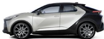
2MR Krómezüst/fekete tetővel, hátsó lökhárítóval metálfényezés elérhető a GR SPORT (Dynamic csomag) és Tokyo Edition felszereltségeken