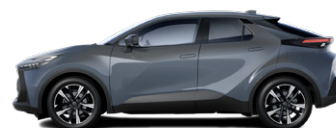
1M2 Viharszürke metálfényezés 270000 Ft elérhető a Comfort, Comfort Plus, Style és Style bi-tone felszereltségeknél