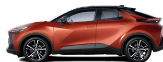
M35 Lávavörös/fekete tetővel metálfényezés elérhető a Style, Style bi-tone, Executive es GR SPORT felszereltségeken elérhető a Style, Style bi-tone, Executive es GR SPORT felszereltségeken