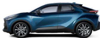
785 Sötét zöldeskék metálfényezés 270000 Ft elérhető a Comfort, Comfort Plus, Style és Style bi-tone felszereltségeknél