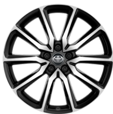
20" könnyűfém keréktárcsák, 245/40 R20 gumiabroncsok Széria a GR SPORT modelleken (2.0 HEV) és a GR SPORT Dynamic csomaggal (csak a 2.0 PHEV)