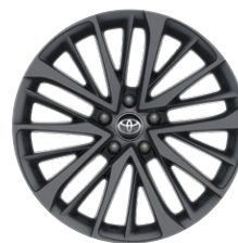
19" Tokyo Edition könnyűfém keréktárcsák 225/50 R19 gumiabroncsokkal Széria a Tokyo Edition modellváltozaton