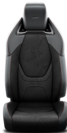
Fekete suede, szintetikus bőr ülésborítás Alapfelszereltség: GR SPORT