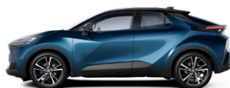
2YB Sötét zöldeskék/fekete tetővel elérhető a Style, Style bi-tone, Executive es GR SPORT felszereltségeken