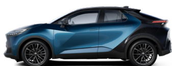
2YB Sötét zöldeskék/fekete tetővel, hátsó lökhárítóval elérhető a GR SPORT (Dynamic csomag) és Tokyo Edition felszereltségeken