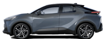
M29 Viharszürke/fekete tetővel metálfényezés elérhető a Style, Style bi-tone, Executive es GR SPORT felszereltségeken