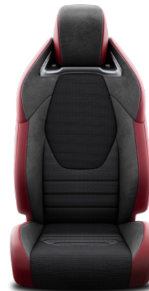
Fekete szövet ülésborítás, Dinamica® szövetelemekkel és bordó szintetikus bőr betétekkel Alapfelszereltség: Tokyo Edition