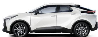
089 Platina gyöngyfehér prémium fényezés 350000 Ft elérhető a Comfort, Comfort Plus, Style és Style bi-tone felszereltségeknél