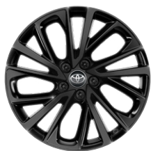
19" GR SPORT könnyűfém keréktárcsák, 225/50 R19 gumiabroncsok Széria a GR SPORT modellváltozaton (kivéve 2.0 HEV)