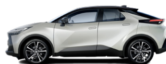
2MR Krómezüst/fekete tetővel metálfényezés elérhető a Style, Style bi-tone, Executive es GR SPORT felszereltségeken