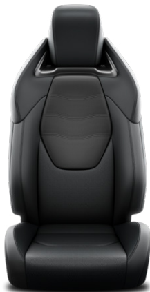
Fekete természetes és szintetikus bőr ülésborítás Alapfelszereltség: Executive