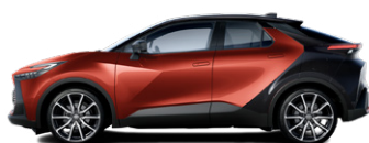
M35 Lávavörös/fekete tetővel, hátsó lökhárítóval metálfényezés elérhető a GR SPORT (Dynamic csomag) és Tokyo Edition felszereltségeken