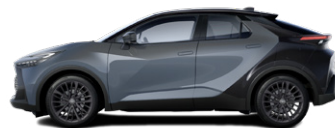
M29 Viharszürke/fekete tetővel, hátsó lökhárítóval metálfényezés elérhető a GR SPORT (Dynamic csomag) és Tokyo Edition felszereltségeken