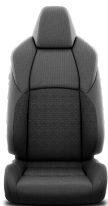
Fekete szövet ülésborítás Alapfelszereltség: Comfort