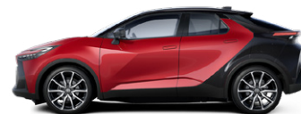
2TB Érzéki vörös/fekete tetővel, hátsó lökhárítóval különleges fényezés elérhető a GR SPORT (Dynamic csomag) és Tokyo Edition felszereltségeken