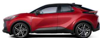
2TB Érzéki vörös/fekete tetővel különleges fényezés elérhető a Style, Style bi-tone, Executive es GR SPORT felszereltségeken