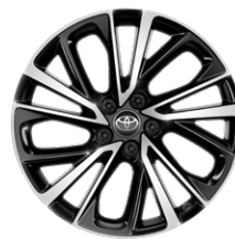
19" könnyűfém keréktárcsák, 225/50 R19 gumiabroncsok Széria az Executive modellváltozaton