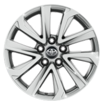
17" könnyűfém keréktárcsák, 215/60 R17 gumiabroncsok Széria a Comfort és Comfort Plus modellváltozaton