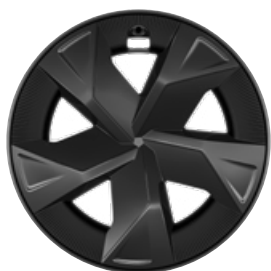
17" sötétszürke könnyűfém keréktárcsák aerodinamikai terelővel 195/60 R17 gumibroncs Széria a Comfort szereltségnél