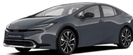
1M2 Hamu szürke* 300000 Ft