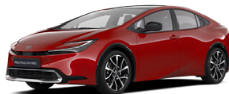
3U5 Érzéki Vörös 300000 Ft