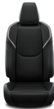
Fekete mesterséges bőr ülésborítás Széria az Executive szereltségben