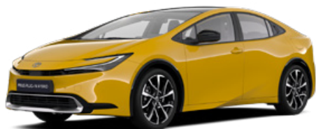
5C5 Mustársárga metál* 200000 Ft