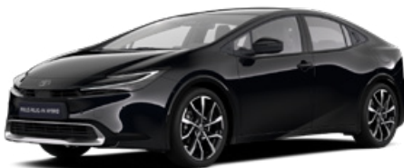
218 Fekete metál* 200000 Ft