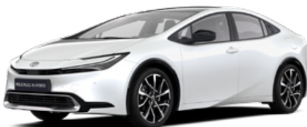
089 Gyöngy fehér 300000 Ft