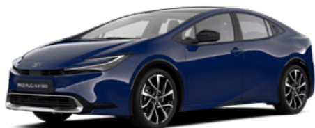
8Q4 Sötétkék felár nélkül