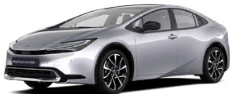
1L0 Palladium ezüst* 200000 Ft