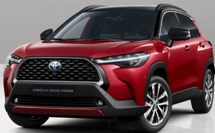
Corolla Cross egytónusú színválaszték.