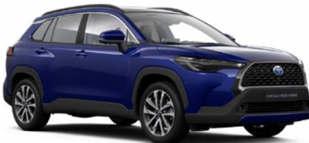
8W7 Kobaltkék* 190 000 Ft