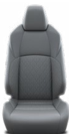
Szürke szövet ülésborítás Alapfelszereltség a Comfort, Style és Style Tech felszereltségnél