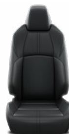
Fekete bőr ülésborítás Alapfelszereltség az Executive felszereltségnél