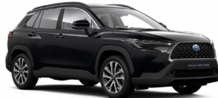
218 Attitude fekete 190 000 Ft