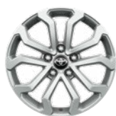
17" könnyűfém keréktárcsák 215/60 R17 Alapfelszereltség: Comfort