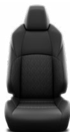
Fekete szövet ülésborítás Alapfelszereltség a Comfort, Style és Style Tech felszereltségnél