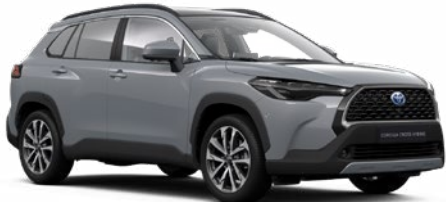
1H5 Manhattan szürke* 190 000 Ft