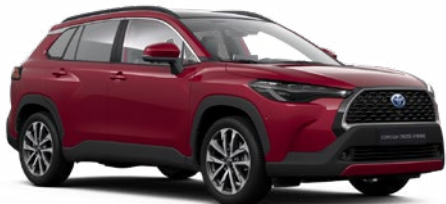
3T3 Prémium vörös** 290 000 Ft