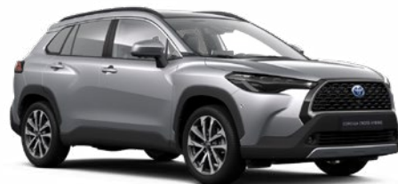
110 Palladium ezüst* 190 000 Ft