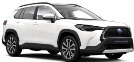
040 Hófehér felár nélkül