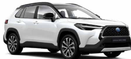
2PS Platina gyöngyfehér fekete tetővel* felár nélkül Premier Edition változathoz