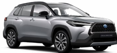
M12 Palladium ezüst fekete tetővel* felár nélkül Premier Edition változathoz