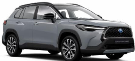
2YY Manhattan szürke fekete tetővel* felár nélkül Premier Edition változathoz