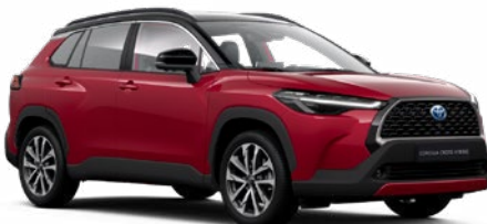
2YD Prémium vörös fekete tetővel* felár nélkül Premier Edition változathoz