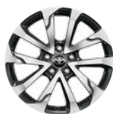
18" könnyűfém keréktárcsák 225/50 R18 Alapfelszereltség: Style és Premier Edition