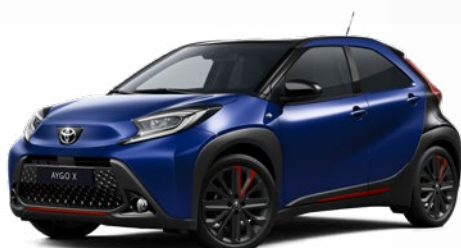
2VL Boróka kék fekete tetővel Felár nélkül Elérhető a Style Design felszereltségnél