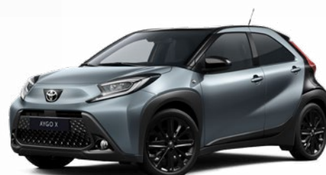
2UP Szürkéskék fekete tetővel Felár nélkül Elérhető a Style Design felszereltségnél