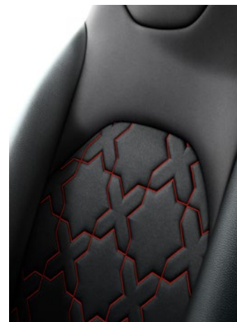
Szövet-bőr (szintetikus) ülésborítás Alapfelszereltség: Executive