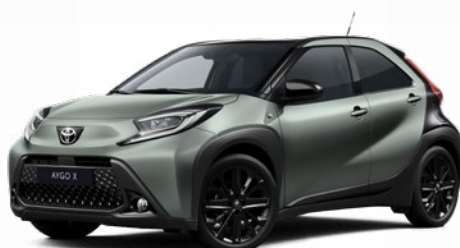
2VN Olivazöld fekete tetővel Felár nélkül Elérhető a Style Design felszereltségnél