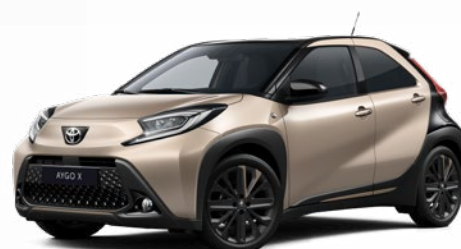
2VJ Gyömbér bézs fekete tetővel Felár nélkül Elérhető a Style Design felszereltségnél