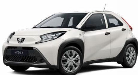
040 Hófehér Felár nélkül Elérhető a Comfort felszereltségnél