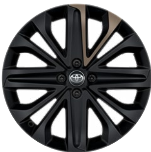
18" matt fekete könnyűfém keréktárcsák bézs betéttel, 175/60 R18 Alapfelszereltség: Style Design (2VJ és 2VK karosszériaszín)