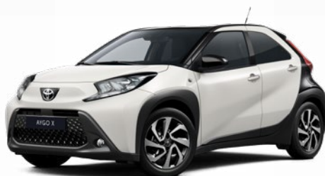
2NR Hófehér fekete tetővel Felár nélkül Elérhető a Style felszereltségnél