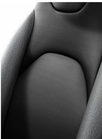
Sötétszürke szövet ülésborítás Alapfelszereltség: Comfort