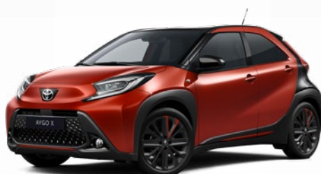
2VH Chilivörös fekete tetővel Felár nélkül Elérhető a Style Design felszereltségnél