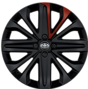
18" matt fekete könnyűfém keréktárcsák piros betéttel, 175/60 R18 Alapfelszereltség: Style Design (2VH és 2VL karosszériaszín)