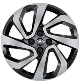
17" könnyűfém keréktárcsák, 175/65 R17 gumiabroncs Alapfelszereltség: Style