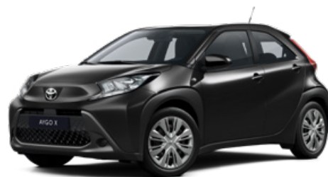
209 Éjfe fekete* 160 000 Ft Elérhető a Comfort felszereltségnél