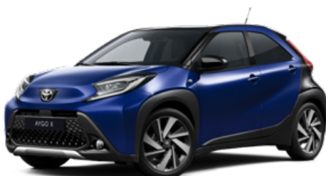
2VL Boróka kék fekete tetővel Felár nélkül Elérhető a Style és Executive felszereltségnél