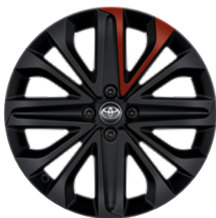
18" matt fekete könnyűfém keréktárcsák piros betéttel, 175/60 R18 Alapfelszereltség: Style Design (2VH és 2VL karosszériaszín)