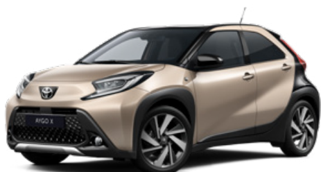
2VJ Gyömbér bézs fekete tetővel Felár nélkül Elérhető a Style és Executive felszereltségnél