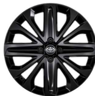
18" matt fekete könnyűfém keréktárcsák éjfeke betéttel, 175/60 R18 Alapfelszereltség: Style Design (2UP és 2VN karosszériaszín)