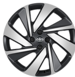
18" könnyűfém keréktárcsák, 175/60 R18 gumiabroncs Alapfelszereltség: Executive