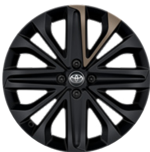
18" matt fekete könnyűfém keréktárcsák bézs betéttel, 175/60 R18 Alapfelszereltség: Style Design (2VJ és 2VK karosszériaszín)