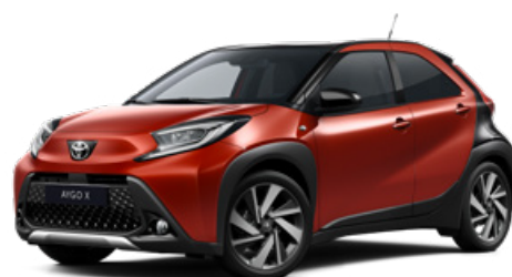
2VH Chilivörös fekete tetővel Felár nélkül Elérhető a Style és Executive felszereltségnél