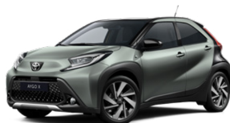
2VN Olivazöld fekete tetővel Felár nélkül Elérhető a Style és Executive felszereltségnél