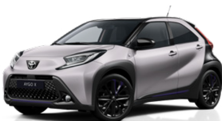
M14 Jázminezüst fekete tetővel Felár nélkül Elérhető a JBL Edition felszereltségnél