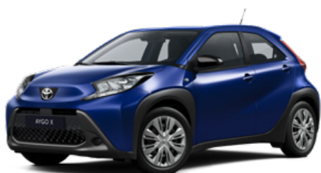
8Y8 Boróka kék* 160 000 Ft Elérhető a Comfort felszereltségnél