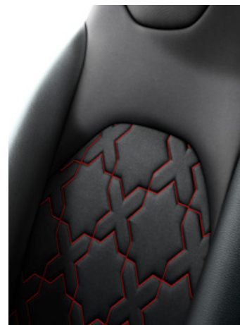
Szövet-bőr (szintetikus) ülésborítás Alapfelszereltség: Executive