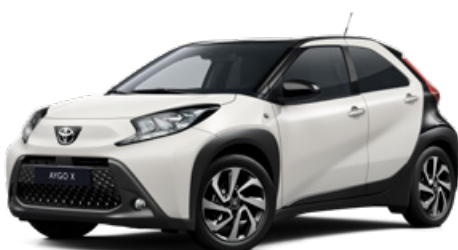
2NR Hófehér fekete tetővel Felár nélkül Elérhető a Style felszereltségnél