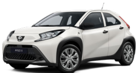
040 Hófehér Felár nélkül Elérhető a Comfort felszereltségnél