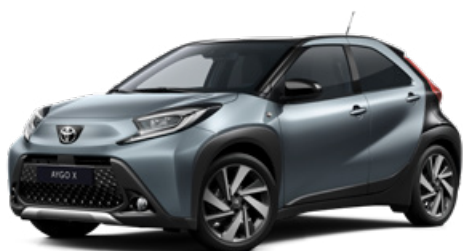
2UP Szürkéskék fekete tetővel Felár nélkül Elérhető a Style és Executive felszereltségnél