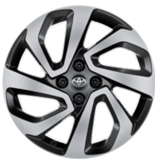
17" könnyűfém keréktárcsák, 175/65 R17 gumiabroncs Alapfelszereltség: Style