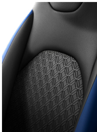
Fekete szövet ülésborítás, oldala a karosszéria színében Alapfelszereltség: Style 2VH, 2VJ, 2VL, 2VN és 2UP színekben