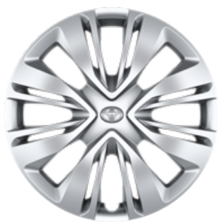
17" acél keréktárcsák dísz tárcsával, 175/65 R17 gumiabroncs Alapfelszereltség: Comfort