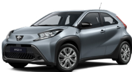
1K3 Szürkéskék* 160 000 Ft Elérhető a Comfort felszereltségnél