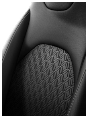
Fekete szövet ülésborítás, fehér varrással Alapfelszereltség: Style 2NR színben