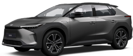
2VC Nikkelezüst, fekete tetővel SS P 120 000 Ft Executive felszereltséghez rendelhető