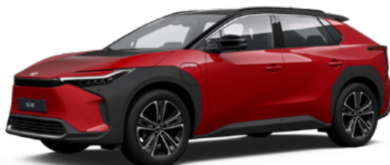
2TB Érzéki vörös, fekete tetővel SS P 120 000 Ft Executive felszereltséghez rendelhető