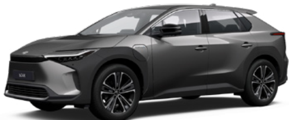
1L5 Nikkelezüst SS P 120 000 Ft