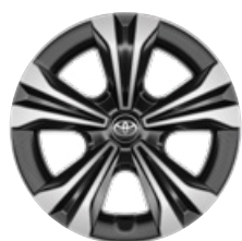
18" könnyűfém keréktárcsák, dísz tárcsával