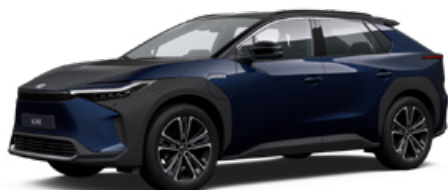
2MT Mélytenger-kék, fekete tetővel S felár nélkül Executive felszereltséghez rendelhető