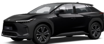
202 Asztrálfekete S felár nélkül