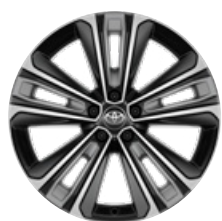
20" könnyűfém keréktárcsák, porvédő kupakkal