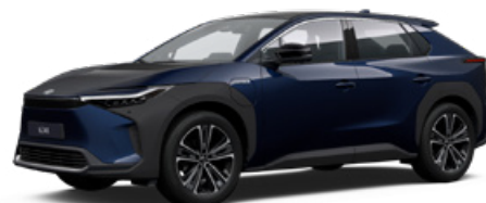
8S6 Mélytenger-kék S felár nélkül