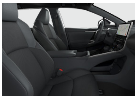
Bőr ülésborítás szövet betétekkel (szintetikus bőr) Alapfelszereltség: Prestige