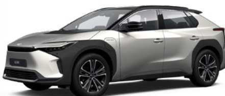
2MR Krómezüst, fekete tetővel SS P 100 000 Ft Executive felszereltséghez rendelhető