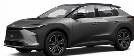
2VC Nikkelezüst, fekete tetővel SS P 100 000 Ft Executive felszereltséghez rendelhető