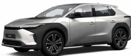
1J6 Krómezüst SS P 100 000 Ft