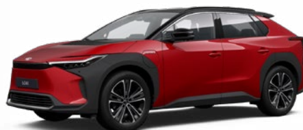
2TB Érzéki vörös, fekete tetővel SS P 100 000 Ft Executive felszereltséghez rendelhető