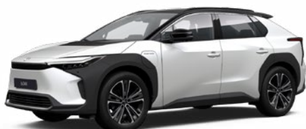
2VP Platina gyöngyfehér, fekete tetővel SS P 100 000 Ft Executive felszereltséghez rendelhető