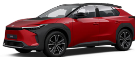
2TB Érzéki vörös, fekete tetővel §§ 120 000 Ft Executive felszereltséghez rendelhető