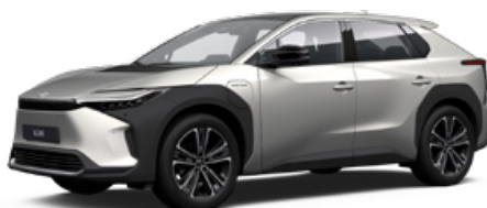
1J6 Krómezüst §§ 120 000 Ft