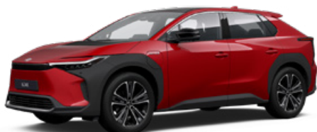
3U5 Érzéki vörös §§ 120 000 Ft