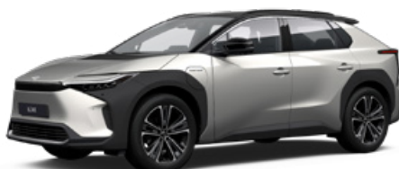
2MR Krómezüst, fekete tetővel §§ 120 000 Ft Executive felszereltséghez rendelhető