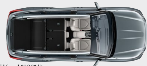
2 ülésel 1909* liter