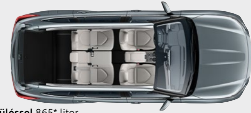
5 ülésel 865* liter