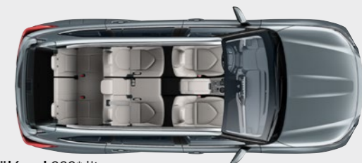
7 ülésel 332* liter

A Highlander kiválóan variálható ülésrendszere minden igényhez, minden úticélhoz alkalmazkodik.