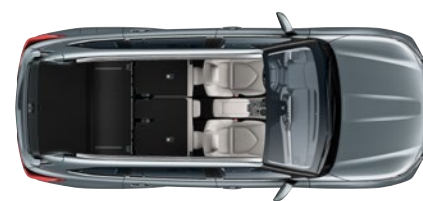
2 ülésel 1909* liter