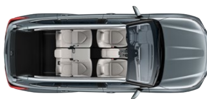
5 ülésel 865* liter