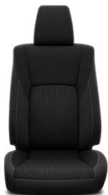
Függőleges mintázatú fekete szövet Alapfelszereltség az Executive modellváltozaton