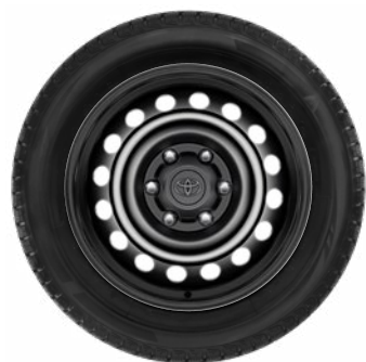
Komplett téli szerelt kerék szett (4 db) 17" acél keréktárcsa, 265/65 R17 BRIDGESTONE BLIZZAK 6 téligumi