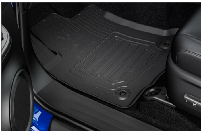
Gumiszőnyeg Nettó ügyfél ár: 33 100 Ft