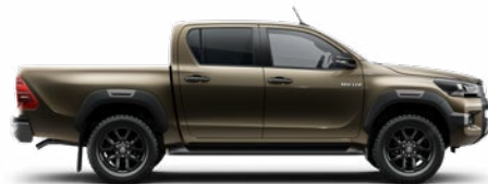
6X1 Barnászöld Metálfényezés nettó 255 000 Ft bruttó 323 850 Ft