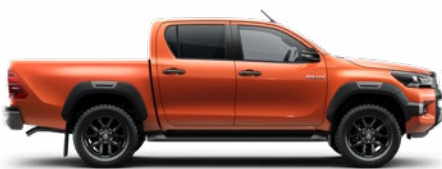
4R8 Narancsmetál Metálfényezés nettó 255 000 Ft bruttó 323 850 Ft