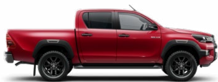
3T6 Lávavörös Metálfényezés nettó 255 000 Ft bruttó 323 850 Ft