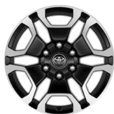
18" fekete, csiszolt felületű könnyűfém keréktárcsa (6 küllős) Alapfelszereltség az Executive modellváltozaton