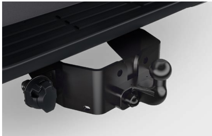
Peremre rögzített vonóhorog Vonóhorog szett 7 pólusú kábellel (márkakereskedői szerelés) Nettó ügyfél ár: 254 400 Ft