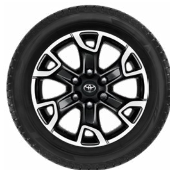
Komplett téli szerelt kerék szett (4 db) 18" könnyűfém keréktárcsa, 265/60 R18 BRIDGESTONE BLIZZAK 6 téligumi