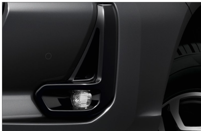
Ködlámpák Nettó ügyfél ár: 226 600 Ft