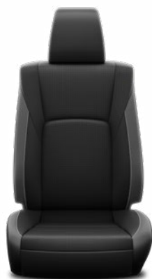
Kéttónusú perforált bőr Alapfelszereltség az Invincible modellváltozaton