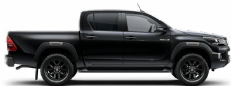
218 Fekete gyöngyház Metálfényezés nettó 255 000 Ft bruttó 323 850 Ft