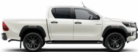
089 Gyöngyfehér* Metálfényezés nettó 310 000 Ft bruttó 393 700 Ft