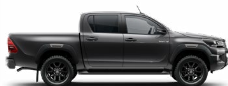
1G3 Hamuszürke Metálfényezés nettó 255 000 Ft bruttó 323 850 Ft