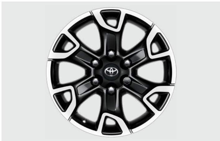
18" fekete, csiszolt hatású könnyűfém keréktárcsák Nettó ügyfél ár: 420 200 Ft