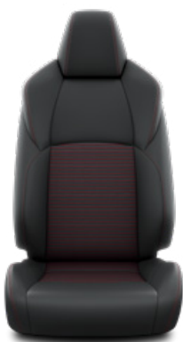
Fekete bőrhatású Alapfelszereltség a Selection modellváltozaton