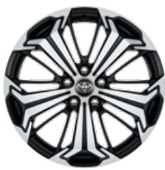
19" fekete, csiszolt felületű könnyűfém keréktárcsa (5 küllős) Alapfelszereltség a Selection és Executive modellváltozaton