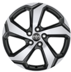
18" szürke, csiszolt felületű könnyűfém keréktárcsa (5 küllős) Alapfelszereltség a Dynamic modellváltozaton