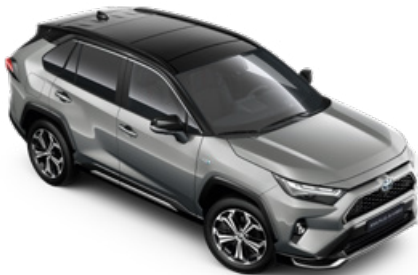
2QY Ezüstmetál fekete tetővel* Selection Platinum felár nélkül