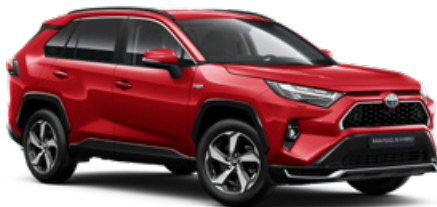
3U5 Érzéki vörös* 350000 Ft