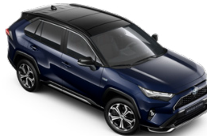
2RA Éjkék fekete tetővel* Selection Sapphire felár nélkül