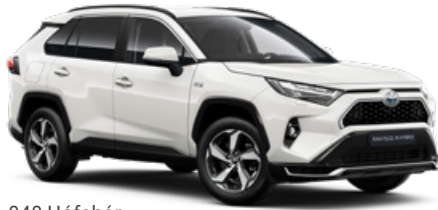
040 Hófehér felár nélkül