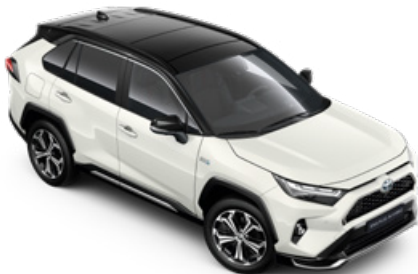
2PS Platina gyöngyfehér fekete tetővel** Selection Pure felár nélkül