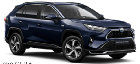
8X8 Éjkék* 250000 Ft