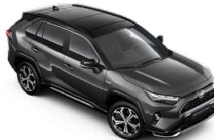
2QZ Hamuszürke fekete tetővel* Selection Graphite felár nélkül