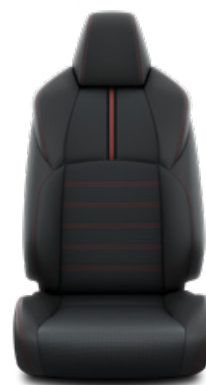
Fekete bőr Alapfelszereltség az Executive modellváltozaton