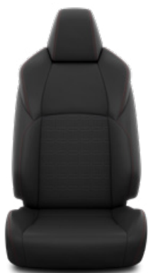
Fekete szövet Alapfelszereltség a Dynamic modellváltozaton