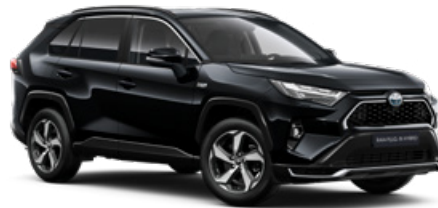
218 Fekete gyöngyház* 250000 Ft