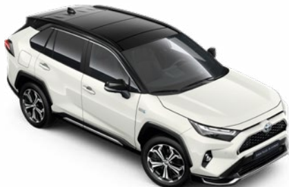
2PS Platina gyöngyfehér fekete tetővel** Selection Pure felár nélkül