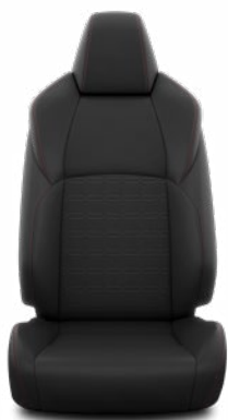
Fekete szövet Alapfelszereltség a Dynamic modellváltozaton