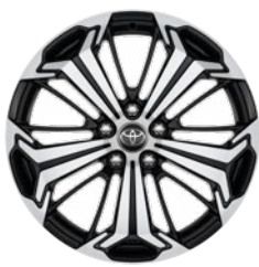
19" fekete, csiszolt felületű könnyűfém keréktárcsa (5 küllős) Alapfelszereltség a Selection és Executive modellváltozaton