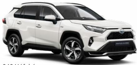
040 Hófehér felár nélkül