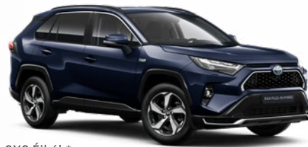
8X8 Éjkék* 250 000 Ft