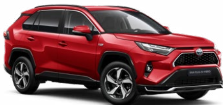
3U5 Érzéki vörös* 350 000 Ft