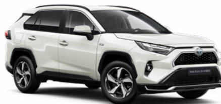
089 Platina gyöngyfehér** 350 000 Ft