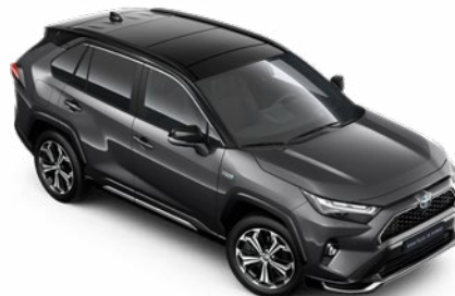
2QZ Hamuszürke fekete tetővel* Selection Graphite felár nélkül