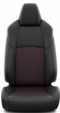
Fekete bőrhatású Alapfelszereltség a Selection modellváltozaton