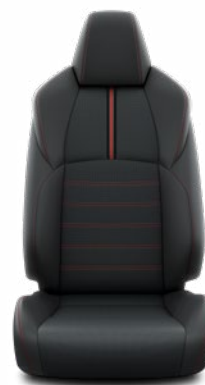
Fekete bőr Alapfelszereltség az Executive modellváltozaton