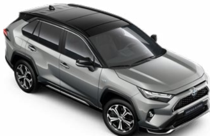
2QY Ezüstmetál fekete tetővel* Selection Platinum felár nélkül