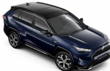
2RA Éjkék fekete tetővel* Selection Sapphire felár nélkül