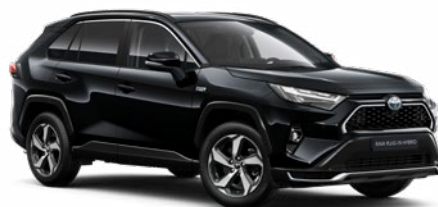
218 Fekete gyöngyház* 250 000 Ft