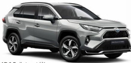
1D6 Ezüstmetál* 250 000 Ft