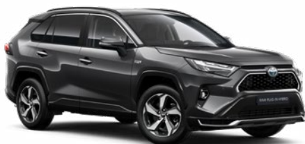
1G3 Hamuszürke* 250 000 Ft