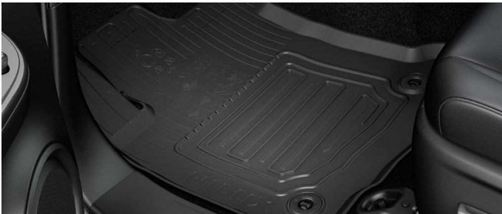
– Gumszőnyeg garnitúra (komplett készlet)