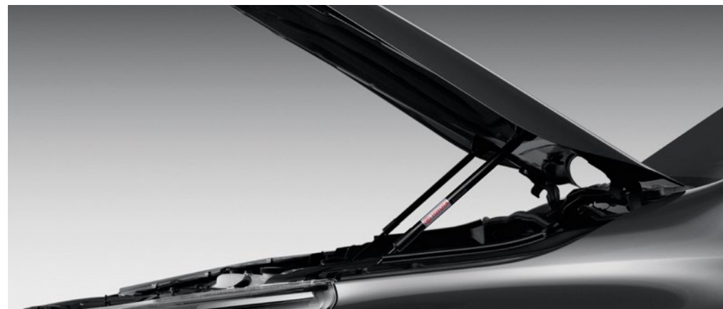
– Könnyített platóajtó nyitás – Könnyített motorháztató nyitás