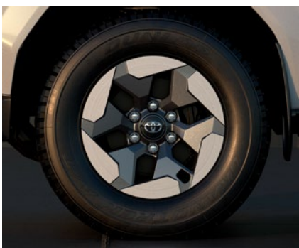
17" könnyűfém keréktárcsák 265/65 R17 gumiabroncsokkal

Alapfelszereltség a Live és Executive változat esetén