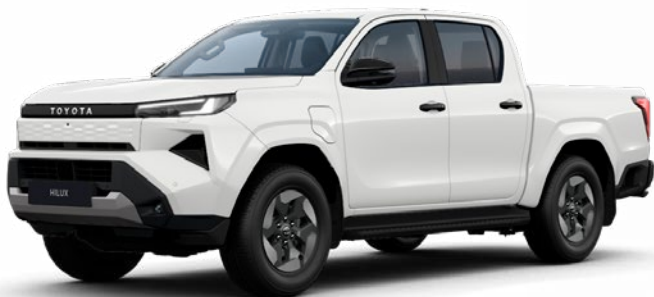
040 HÓFEHÉR alapfényezés felár nélkül

A karosszéria színe a felszereltségi szint függvényében eltérő lehet.