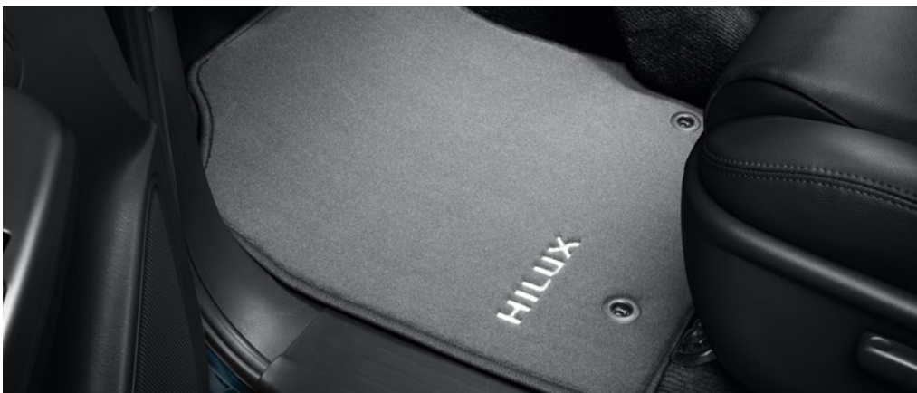
– Textilszőnyeg garnitúra (komplett készlet)