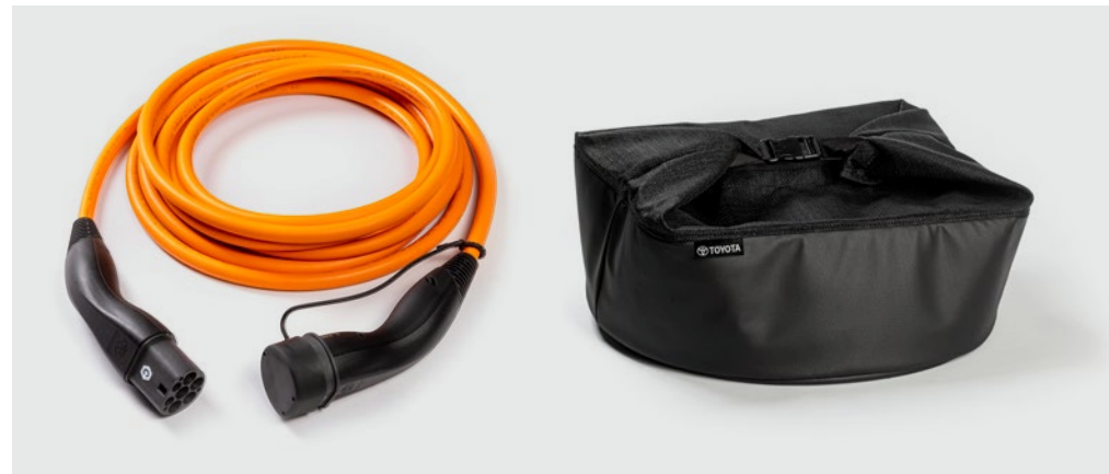
– 7,5 m-es háromfázisú AC töltőkábel (Type 2, 32 A) – Kábel táska