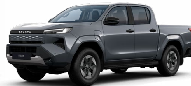
1M2 Hamuszürke metálfényezés Nettó: 310 000 Ft Bruttó: 393 700 Ft