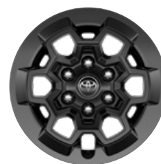
17" fekete GR SPORT könnyűfém keréktárcsák (6 küllős) Alapfelszereltség a GR SPORT modellváltozaton