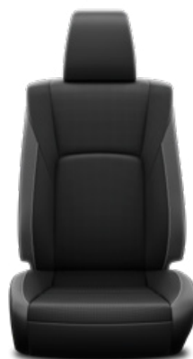
Kéttónusú perforált bőr Alapfelszereltség az Invincible modellváltozaton