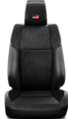
GR SPORT fekete bőr/szövet ezüst himzéssel Alapfelszereltség a GR SPORT modellváltozaton