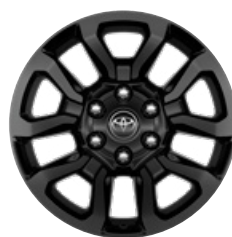
18" fekete könnyűfém keréktárcsa (5 küllős) Alapfelszereltség az Invincible modellváltozaton