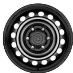
17" fekete acél keréktárcsa Alapfelszereltség a Live extra- és duplakabinos modellváltozaton