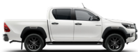
040 Hófehér Alapfényezés felár nélkül