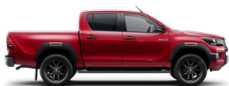
3T6 Lávavörös Metálfényezés nettó 255 000 Ft bruttó 323 850 Ft