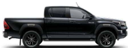
218 Fekete gyöngyház Metálfényezés nettó 255 000 Ft bruttó 323 850 Ft