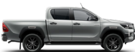
1D6 Ezüstmetál Metálfényezés nettó 255 000 Ft bruttó 323 850 Ft