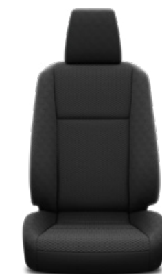
Ovális mintázatú fekete szövet Alapfelszereltség a Live modellváltozaton