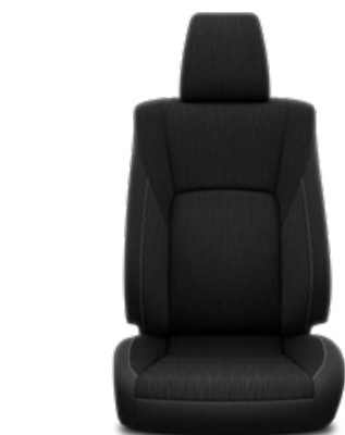
Függőleges mintázatú fekete szövet Alapfelszereltség az Active és Executive modellváltozaton