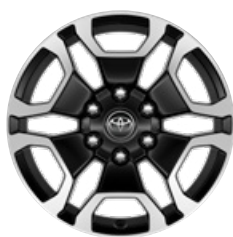
18" fekete, csiszolt felületű könnyűfém keréktárcsa (6 küllős) Alapfelszereltség az Executive modellváltozaton