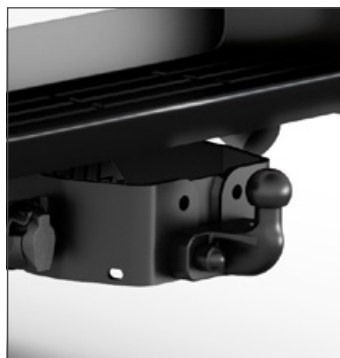
Peremre rögzített vonóhorog Vonóhorog szett 7 pólusú kábellel 300 000 Ft (márkakereskedői szerelés)