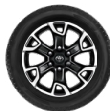
Komplett téli szerelt kerék szett (4 db) 18" könnyűfém keréktárcsa, 265/60R18 CONTINENTAL WINTERCONTACT TS870P téligumi