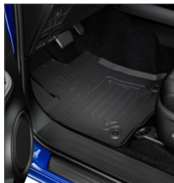
Gumiszőnyeg 40 000 Ft