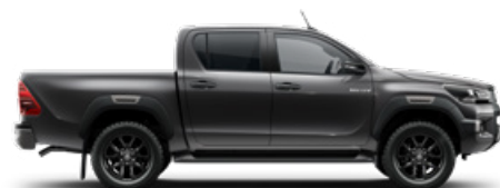
1G3 Hamuszürke Metálfényezés nettó 255 000 Ft bruttó 323 850 Ft