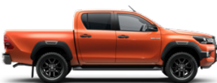
4R8 Narancsmetál Metálfényezés nettó 255 000 Ft bruttó 323 850 Ft