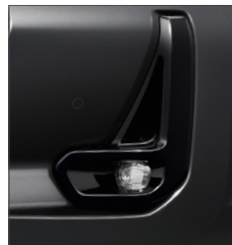
Ködlámpák 376 000 Ft