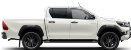
089 Gyöngyfehér* Metálfényezés nettó 310 000 Ft bruttó 393 700 Ft