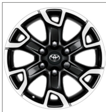
18" fekete, csiszolt hatású könnyűfém keréktárcsák 452 800 Ft