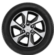
Komplett téli szerelt kerék szett (4 db) 17" könnyűfém keréktárcsa, 265/65R17 BRIDGESTONE LM005 téligumi