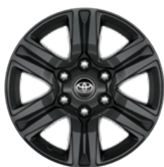
17" sötétszürke könnyűfém keréktárcsa (6 küllős) Alapfelszereltség az Active modellváltozaton