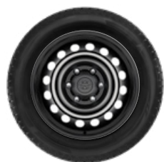
Komplett téli szerelt kerék szett (4 db) 17" acél keréktárcsa, 265/65R17 GOODYEAR SUV téligumi