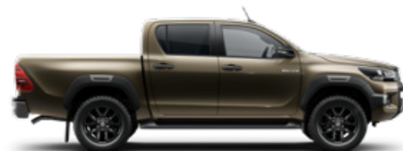
6X1 Barnászöld Metálfényezés nettó 255 000 Ft bruttó 323 850 Ft