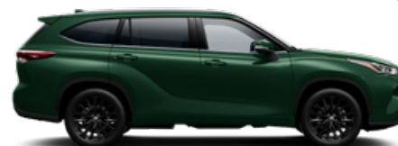
6X5 Ciprus zöld metál metálfényezés