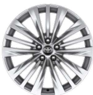
20" ezüstsínű könnyűfém felni 235/55 R20 gumibronccsal Alapfelszereltség a Prestige modellváltozaton