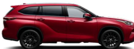
3T3 Vörös prémium metálfényezés