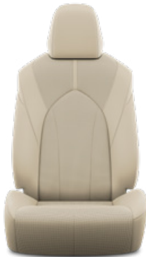
Bézs perforált bőr, steppelt, fekete varrással Alapfelszereltség a Prestige modellváltozaton