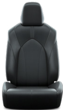
Fekete perforált bőr, steppelt, fekete varrással Alapfelszereltség a Prestige modellváltozaton