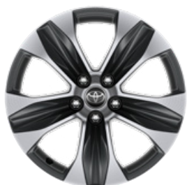
18" sötétszürke, csiszolt felületű könnyűfém felni (5 küllős) 235/65 R18 gumibronccsal Alapfelszereltség a Comfort modellváltozaton