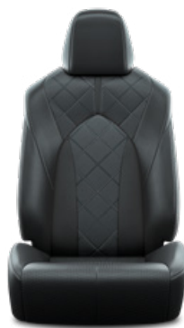
Fekete perforált bőr, gyémántmintázatú, fekete varrással Alapfelszereltség az Executive modellváltozaton