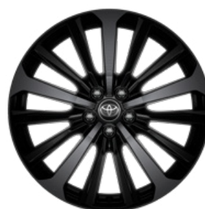
20" fekete könnyűfém felni 235/55 R20 gumibronccsal Alapfelszereltség az Executive modellváltozaton