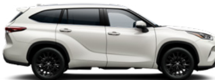
089 Platinagyöngy prémium gyöngyház fényezés