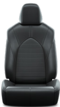
Bőrhátasú szövet Alapfelszereltség a Comfort modellváltozaton