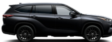
218 Fekete gyöngyház metálfényezés

A Highlander ügyfélárak tartalmazzák a metálfény felárat, a prémium fényezés felárat a Premium felszereltségek tartalmazza.