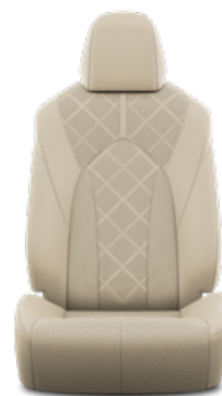
Bézs perforált bőr, gyémántmintázatú, fekete varrással Alapfelszereltség az Executive modellváltozaton