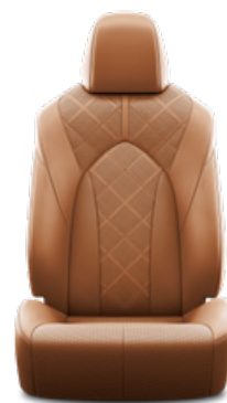
Nyeregbarna perforált bőr, gyémántmintázatú, fekete varrással Alapfelszereltség az Executive modellváltozaton