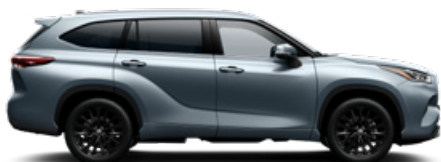
1K5 Holdfény prémium metálfényezés