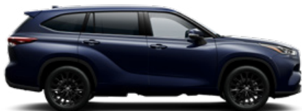
8X8 Sötétkék mica metálfényezés