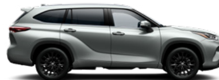
1J9 Ezüstmetál metálfényezés