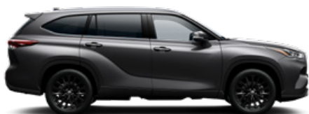
1G3 Hamuszürke metálfényezés