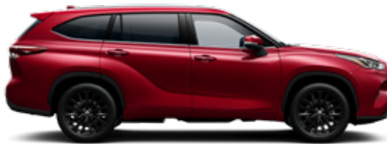
3T3 Vörös prémium metálfényezés