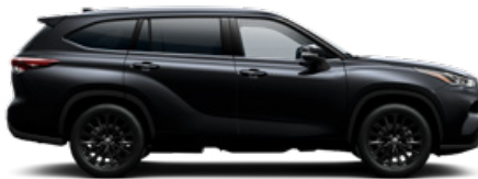
218 Fekete gyöngyház metálfényezés

A Highlander ügyfélárak tartalmazzák a metálfény felárat, a prémium fényezés felárat a Premium felszereltségek tartalmazza.