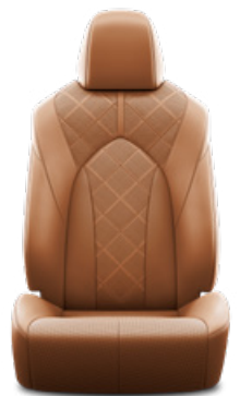
Nyeregbarna perforált bőr, gyémántmintázatú, fekete varrással Alapfelszereltség az Executive modellváltozaton