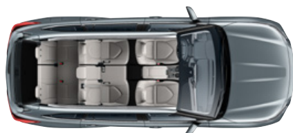
7 ülésel 332* liter 7 üléses változat