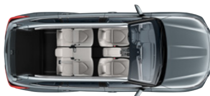
5 ülésel 865* liter