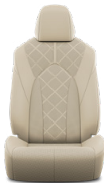
Bézs perforált bőr, gyémántmintázatú, fekete varrással Alapfelszereltség az Executive modellváltozaton