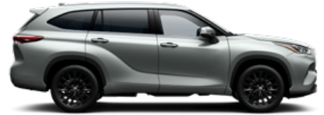
1J9 Ezüstmetál metálfényezés