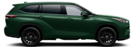
6X5 Ciprus zöld metál metálfényezés