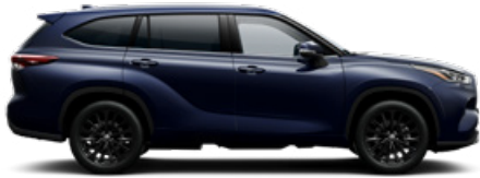
8X8 Sötétkék mica metálfényezés