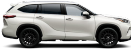
089 Platinagyöngy prémium gyöngyház fényezés