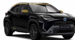
2UB Éjfekete aranymetál tetővel

Metál Elérhető az Adventure és Premiere Edition felszereltségeknél Felár nélkül