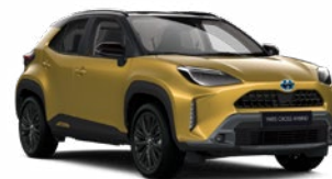
2VS Aranymetál fekete tetővel

Metál Elérhető az Executive, Adventure, GR SPORT és Premiere Edition felszereltségeknél Felár nélkül