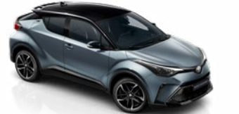
2TH Szürkéskék / fekete tető metálfényezés csak a GR SPORT változatban rendelhető