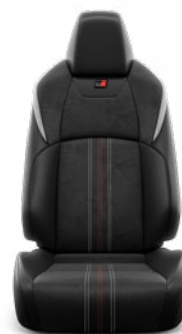
Fekete Alcantara kárpit, bőr betétekkel, szaténkróm színű díszcsikkel Széria a GR SPORT modellváltozaton