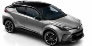
2VU Prémiumezüst / fekete tető különleges fényezés csak a GR SPORT változatban rendelhető