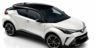
2MQ Hófehér / fekete tető csak a GR SPORT változatban rendelhető