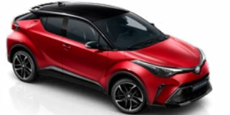
2TB Érzéki vörös / fekete tető különleges fényezés csak a GR SPORT változatban rendelhető