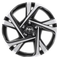
18" fekete, csiszolt hatású könnyűfém keréktárcsa (5 dupla küllős) Széria a Style modellváltozatokon