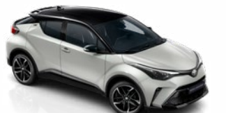
2VF Nikkelszürke / fekete tető metálfényezés csak a GR SPORT változatban rendelhető