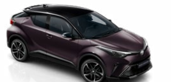
2XE Mély ametisztlila / fekete tető metálfényezés csak a GR SPORT változatban rendelhető