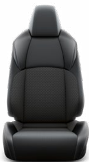
Fekete & sötétszürke szövet ülésborítás bőr betétekkel Széria a Style modellváltozaton