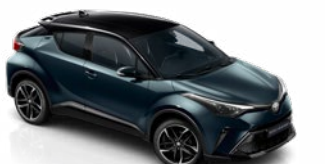
2YB Sötét zöldeskék / 785 fekete tetővel metálfényezés csak a GR Sport változatban rendelhető