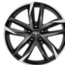
19" GR SPORT könnyűfém keréktárcsa (10 dupla küllős) Széria a GR SPORT modellváltozaton