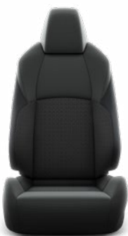
Fekete szövetkárpit, világosszürke varrással Széria a Comfort modellváltozaton