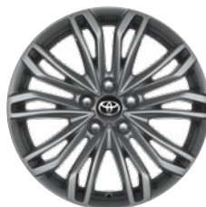
18" ezüst színű könnyűfém keréktárcsa (10 dupla küllős) Széria az Executive modellváltozaton