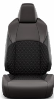
Orchidea-mintás steppelt szövetkárpit, bőr betétekkel Széria az Executive modellváltozaton