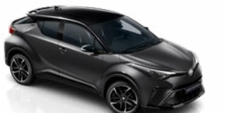
2NB Hamuszürke / fekete tető metálfényezés csak a GR SPORT változatban rendelhető