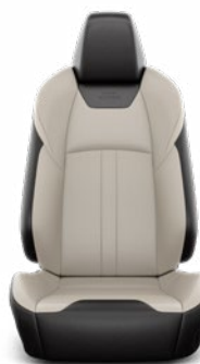
Grézs színű bőr kárpit Széria az Executive VIP modellváltozaton