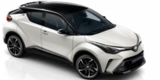
2VP Platina gyöngyfehér / fekete tető gyöngyház fényezés csak a GR SPORT változatban rendelhető