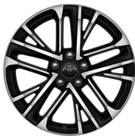
18" csiszolt hatású könnyűfém keréktárcsák 235/45 R18 méretű gumiabroncsokkal Alapfelszereltség a Prestige és az Executive modellváltozatoknál