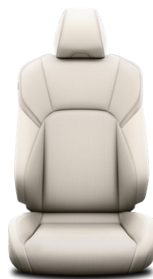
Törtfehér bőr ülésborítás Alapfelszereltség a Prestige és Executive felszereltségnél