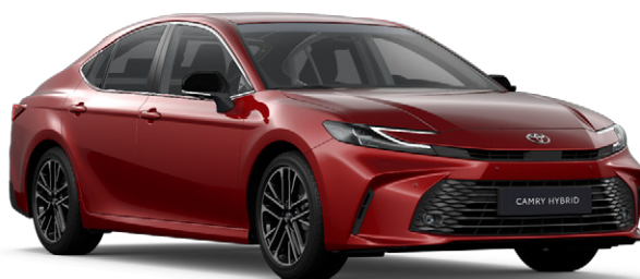
3U9 Érzéki vörös Egyedi 390 000 Ft