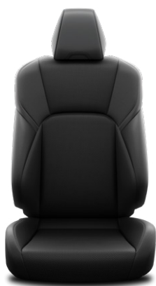
Fekete szintetikus bőr ülésborítás szövet betétekkel Alapfelszereltség a Comfort Business modellváltozatban