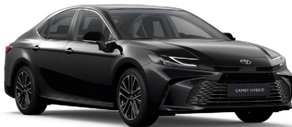
229 Klasszikus fekete Metál 280 000 Ft