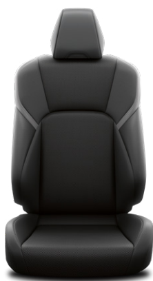
Fekete bőr ülésborítás Alapfelszereltség a Prestige és Executive felszereltségnél