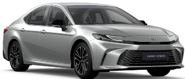
1F7 Ezüstmetál Metál 390 000 Ft