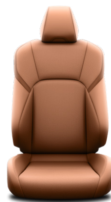
Barna bőr ülésborítás Alapfelszereltség a Prestige és Executive felszereltségnél