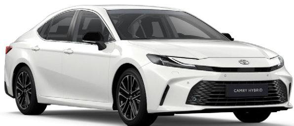
040 Hófehér Alapszín felár nélkül