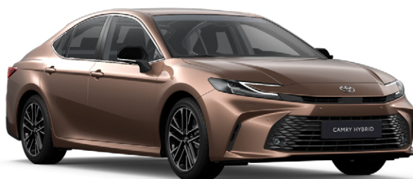
4Y6 Bronz Egyedi 390 000 Ft