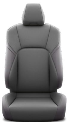
Fekete szövet ülésborítás Alapfelszereltség a Comfort modellváltozatnál