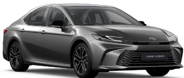
1L5 Sötétszürke metál Metál 390 000 Ft