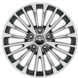
17" könnyűfém keréktárcsák 215/55 R17 gumiabroncsokkal Alapfelszereltség a Comfort modellváltozatnál