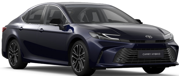
8X8 Sötétkék mica Metál 250 000 Ft