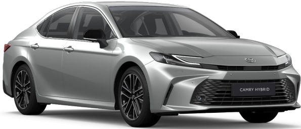
1F7 Ezüstmetál Metál 250 000 Ft