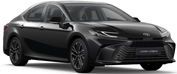
218 Fekete metál Metál 250 000 Ft