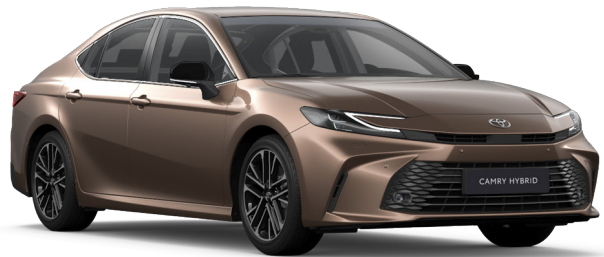
4Y6 Bronz Egyedi 350 000 Ft