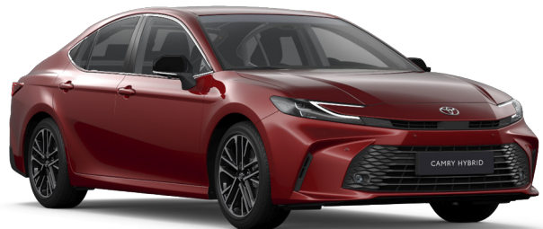
3U9 Érzéki vörös Egyedi 350 000 Ft