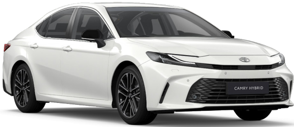
040 Hófehér Alapszín felár nélkül