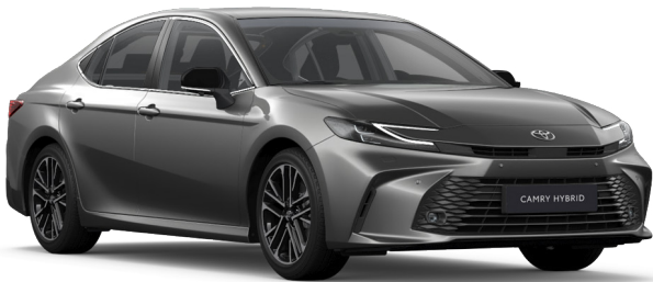
1L5 Sötétszürke metál Metál 250 000 Ft