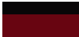
2SZ GR SPORT Passion felár nélkül