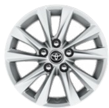
16" könnyűfém keréktárcsák 205/55 R16 gumiabronccsal Alapfelszereltség: Comfort, Comfort + Tech