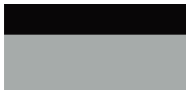
2TX GR SPORT Prémium ezüst felár nélkül