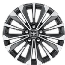
17" könnyűfém keréktárcsák 225/45 R17 gumiabronccsal Alapfelszereltség: Style