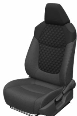
Fekete szövet ülésborítás steppelt fekete betétekkel Alapfelszereltség a Comfort Tech és Comfort Style Tech felszereltségnél