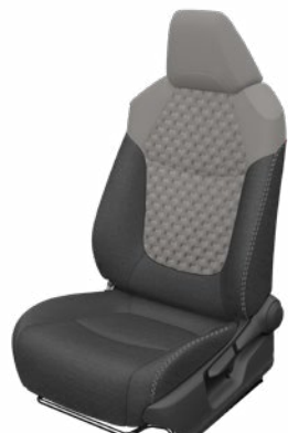
Szürke szövet ülésborítás steppelt világosszürke betétekkel Alapfelszereltség a Comfort Tech és Comfort Style Tech felszereltségnél