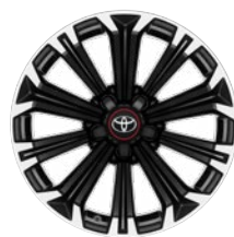
17" könnyűfém keréktárcsák 225/45 R17 gumiabroncsok Alapfelszereltség: GR SPORT