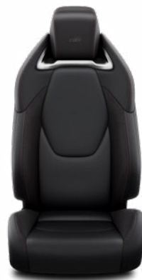
Sötétszürke szövet és szintetikus bőr ülésborítás GR SPORT logoval Alapfelszereltség a GR SPORT és GR SPORT Dynamic felszereltségnél