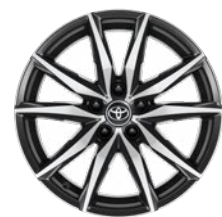
18" könnyűfém keréktárcsák 225/40 R18 gumiabronccsal Alapfelszereltség: GR SPORT + Dynamic