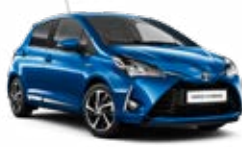
8X2 Vízkék metálfényezés 135 000 Ft