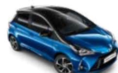
2PP Vízkék fekete tetőfényezéssel metálfényezés csak a Selection változatban rendelhető