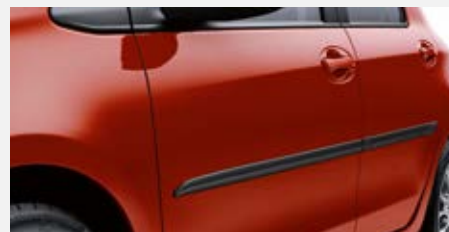
Oldalvédőcsík készlet 31 700 Ft