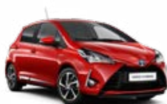
3P0 Tűzpiros 50 000 Ft