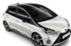
2NS Gyöngyházfehér fekete tetőfényezéssel metálfényezés csak a Selection változatban rendelhető