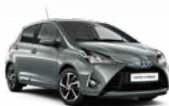
1H5 Manhattan sötét metálfényezés 135 000 Ft