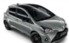
2QS Manhattan sötét fekete tetőfényezéssel metálfényezés csak a GR Sport változatban rendelhető