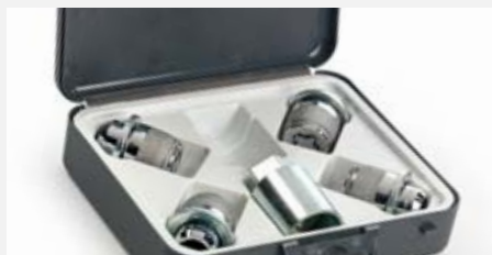
Kerékrő szett 15 900 Ft