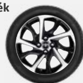
Komplett téli szerelt kerék 445 600 Ft/4db

15"-os téli szerelt kerék alufelnyel és Continental WinterContact TS 810 gumiabronccsal