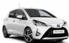
040 Hófehér felár nélkül