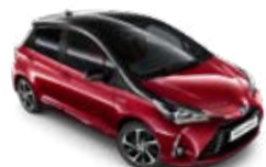
2PN Burgundi vörös fekete tetőfényezéssel metálfényezés csak a Selection változatban rendelhető