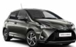
1G2 Platinum bronz metálfényezés 135 000 Ft