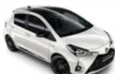
2NR Hófehér fekete tetőfényezéssel metálfényezés csak a GR Sport változatban rendelhető