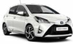
084 Gyöngyházfehér 185 000 Ft