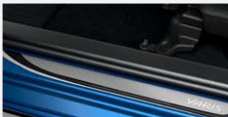
Alumínium küszöbborítás (az első ajtókhoz) 31 700 Ft