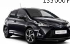
209 Éjfele metálfényezés 135 000 Ft