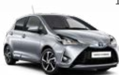
1F7 Ultra ezüst metálfényezés 135 000 Ft