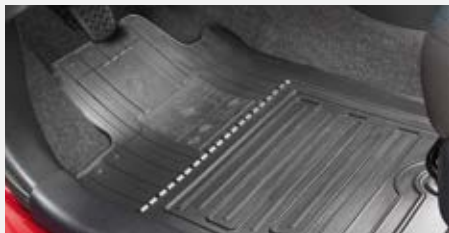
Gumiszőnyeg garnitúra 18 700 Ft