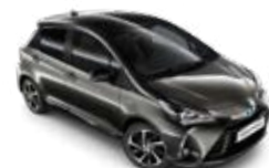
2NT Platinum bronz fekete tetőfényezéssel metálfényezés csak a Selection változatban rendelhető