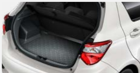
Csomagtértálca 19 300 Ft