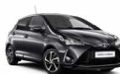
1G3 Hamuszürke metálfényezés 135 000 Ft