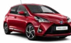
3T3 Burgundi vörös 185 000 Ft