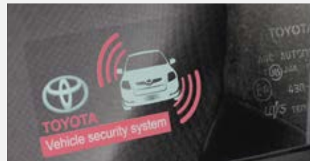
Riasztó 76 300 Ft