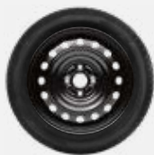
Komplett téli szerelt kerék 203 000 Ft/4db

15"-os téli szerelt kerék acélfelnyel és Semperit Master-Grip 2 gumiabronccsal