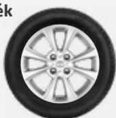
Komplett téli szerelt kerék 323 800 Ft/4db

15"-os téli szerelt kerék acélfelnyel és Semperit Master-Grip 2 gumiabronccsal