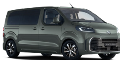
EDU Terepzöld Metálfényezés Bruttó 280 000 Ft

A karosszéria színe a felszereltségi szinttől is függhet.