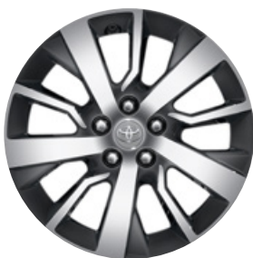
17" könnyűfém keréktárcsák