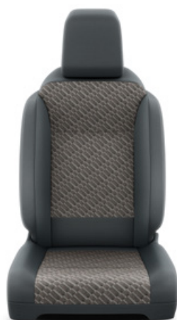
Fekete szövet barna betétekkel Alapfelszereltség Family modelleken