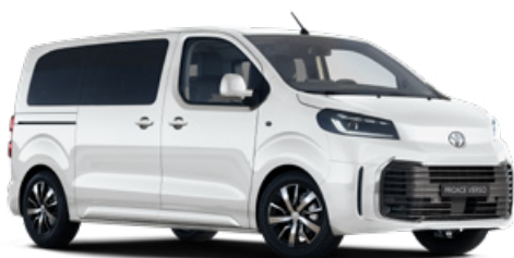
EPR Hófehér felár nélkül