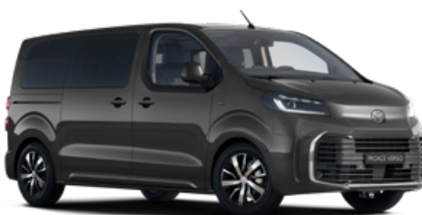
KKJ Titánszürke Metálfényezés Bruttó 280 000 Ft