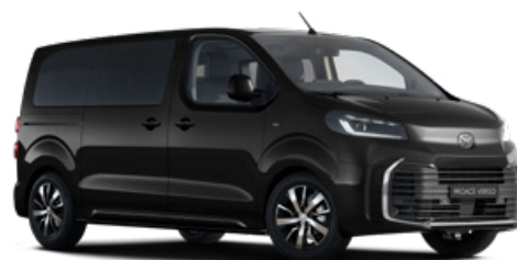
KTV Éjfekete Metálfényezés Bruttó 280 000 Ft