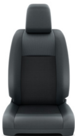
Fekete szövet ülésborítás Alapfelszereltség Combi és Business modelleken