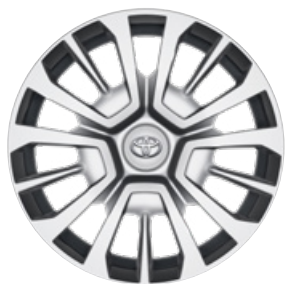
16" / 17" acél keréktárcsák dísz tárcsával