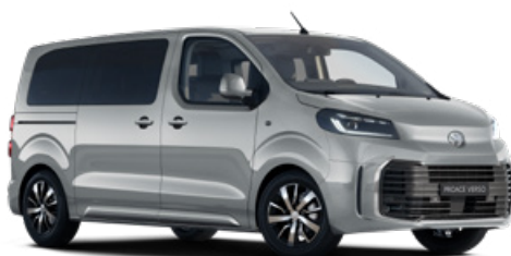
KCA Ezüst Metálfényezés Bruttó 280 000 Ft