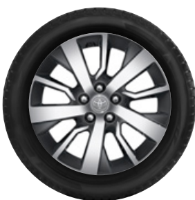
Komplett téli szerelt kerék szett (4db)

Téli szerelt kerék 17" TMEWA00138UY 215/60R17 109T Falken EWNVN01 alufelnivel