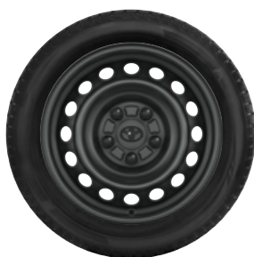
Komplett téli szerelt kerék szett (4db)

Téli szerelt kerék 16" TMEWS00038DY 215/65R16C 109/107T Bridgestone W810 acélfelnivel