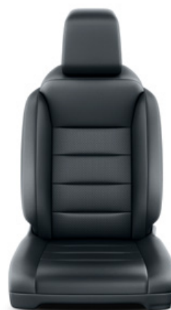
Fekete bőr Alapfelszereltség VIP modelleken