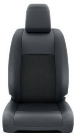
Fekete szövet ülésborítás Alapfelszereltség Combi és Business modelleken