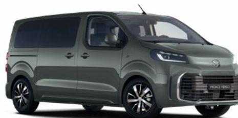
EDU Terepzöld Metálfényezés Bruttó 280 000 Ft

A karosszéria színe a felszereltségi szinttől is függhet.