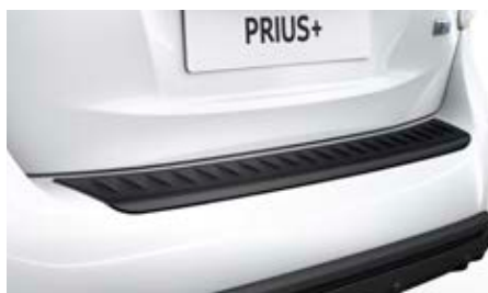
Hátsó lökhárító védőlemez